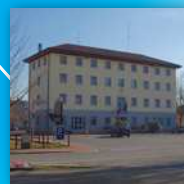
Comune Sala Bolognese

TERRE D'ACQUA Terre di grandi imprenditori, artigiani, artisti, innovatori