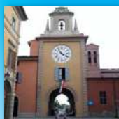
Comune Sant'agata Bolognese