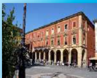
Comune San Giovanni in Persiceto