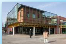
Comune Anzola dell'Emilia